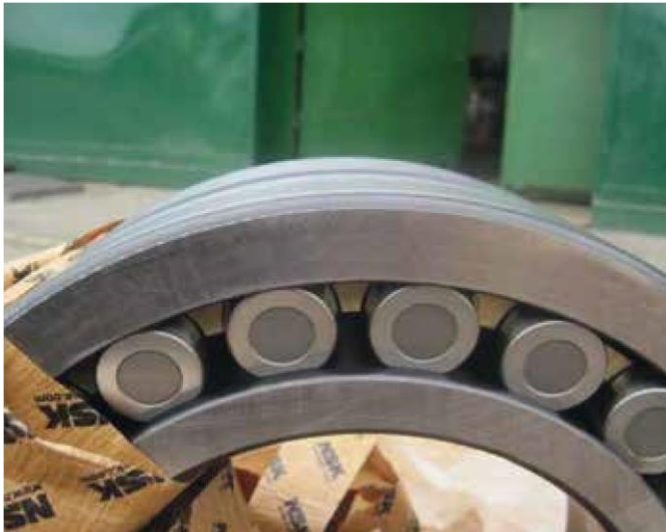
A. Prodotto NSK originale