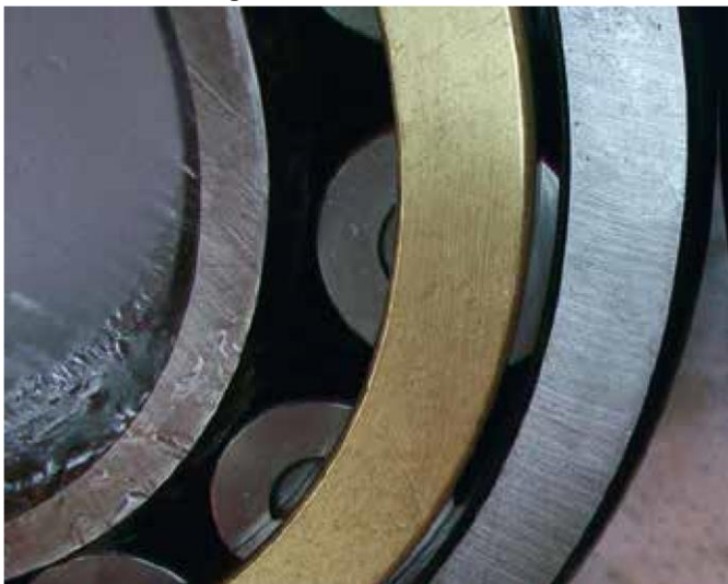
A. Prodotto NSK originale