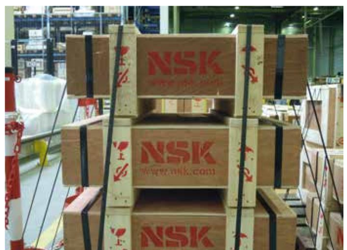
Logo NSK corretto su casse di legno

Per qualsiasi dubbio su un prodotto NSK che avete acquistato, non esitate a contattare il vostro Distributore locale o direttamente NSK Europe all'indirizzo info-it@nsk.com . La vostra segnalazione verrà indirizzata al commerciale responsabile della vostra zona.