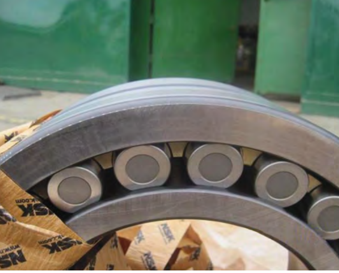
A. Orijinal NSK Ürünü