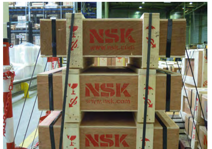
Ahşap kutular üzerindeki doğru NSK logosu

Satın aldığınız bir NSK ürünü hakkında endişeleriniz varsa, lütfen yerel distribütörünüzle veya doğrudan NSK Avrupa ile irtibata geçin: info-uk@nsk.com . Talebiniz bölgenizde yetkili satış personeline iletilecektir.